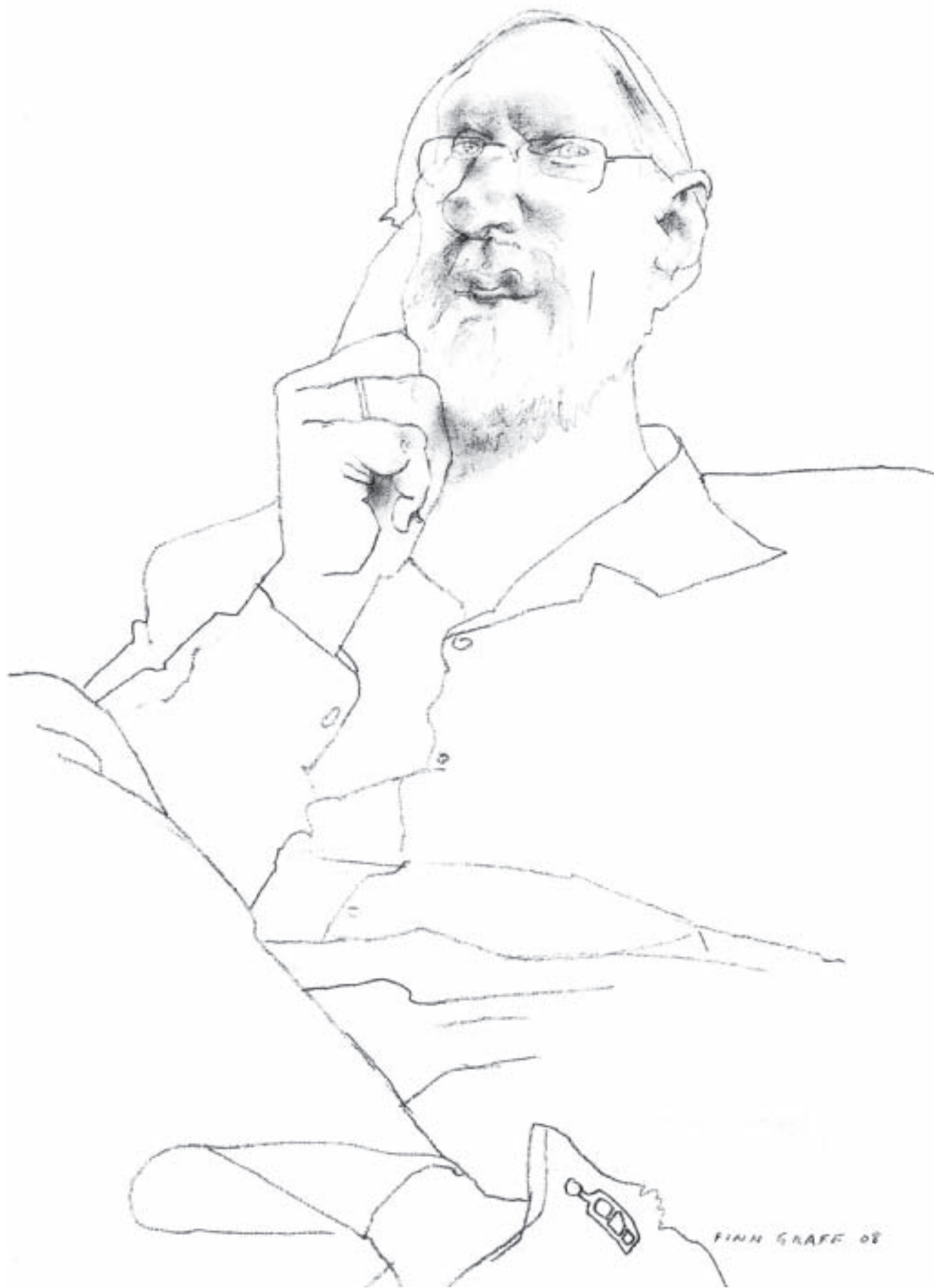
Morten Anker tegnet av Finn Graff