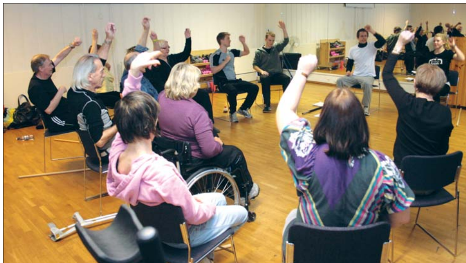
Studenter fra Høgskolen i Sør-Trøndelag leder chairobicstreningen.

Resultatet kan man oppleve på Nidarø Treningssenter hver onsdag.