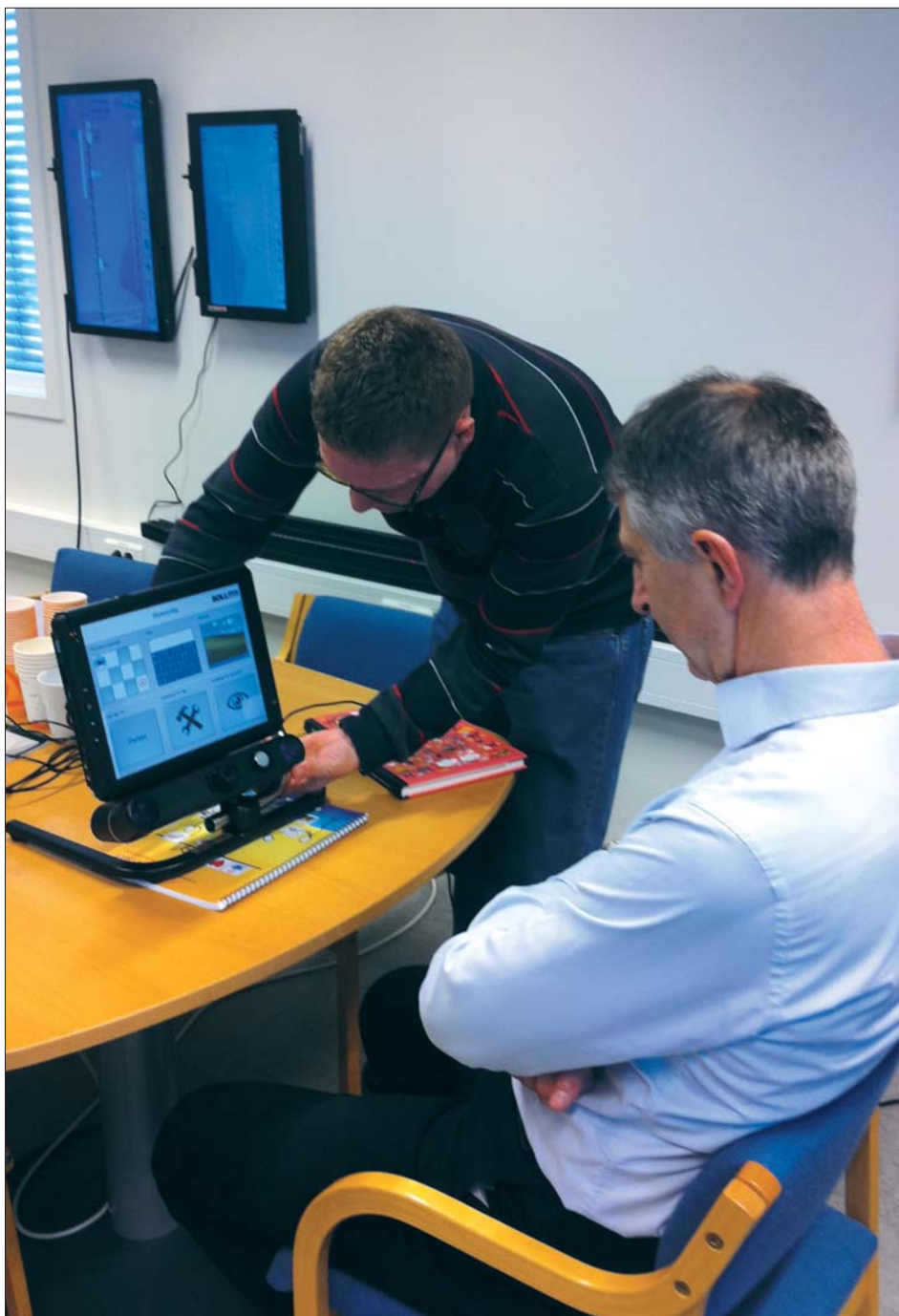
På hjelpemiddelsentralen i Vestfold får Nav-sjefen hjelp til å skrive på PC ved hjelp av øyene.

– Jeg fikk skrive på en PC ved hjelp av synet. Når jeg så på en tast, ble bokstaven skrevet. Jeg fikk også oppleve det jeg skrev. Fantastisk! Se her, jeg har bilde av det! Hjelpemiddelsentralene og andre deler av Nav driver også kunnskapsarbeid overfor arbeidsgiverne. Er de skeptiske til å ansette funksjonshemmede, sier vi: Hør her, dette er ikke noe problem, dette ordner vi. Det finnes løsninger på de fleste utfordringer. Våre spesialister på tilrettelegging jobber sammen med arbeidsgiver for å finne gode løsninger for den enkelte. Det kan være spesialbygde bord og stoler, PCer eller andre hjelpemidler.