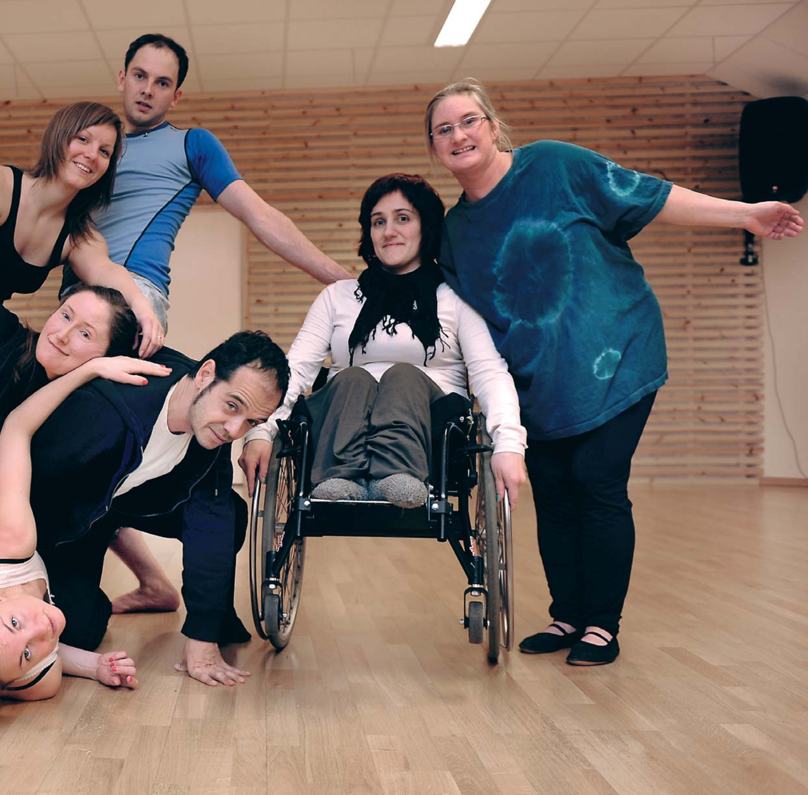
Ulikekroppede mennesker i aksjon.