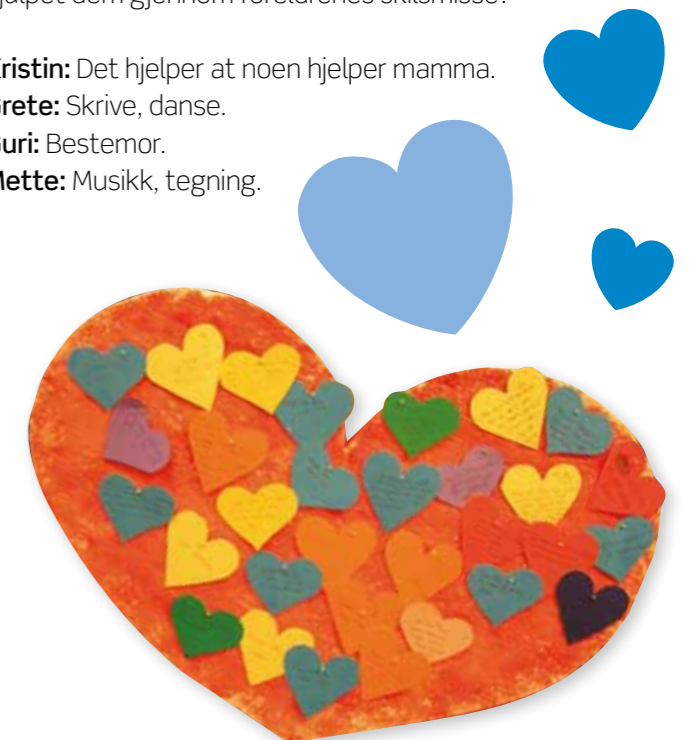
Ressurshjerte viser blant annet hvilke erfaringer elevene har fått med seg etter foreldrenes brudd.