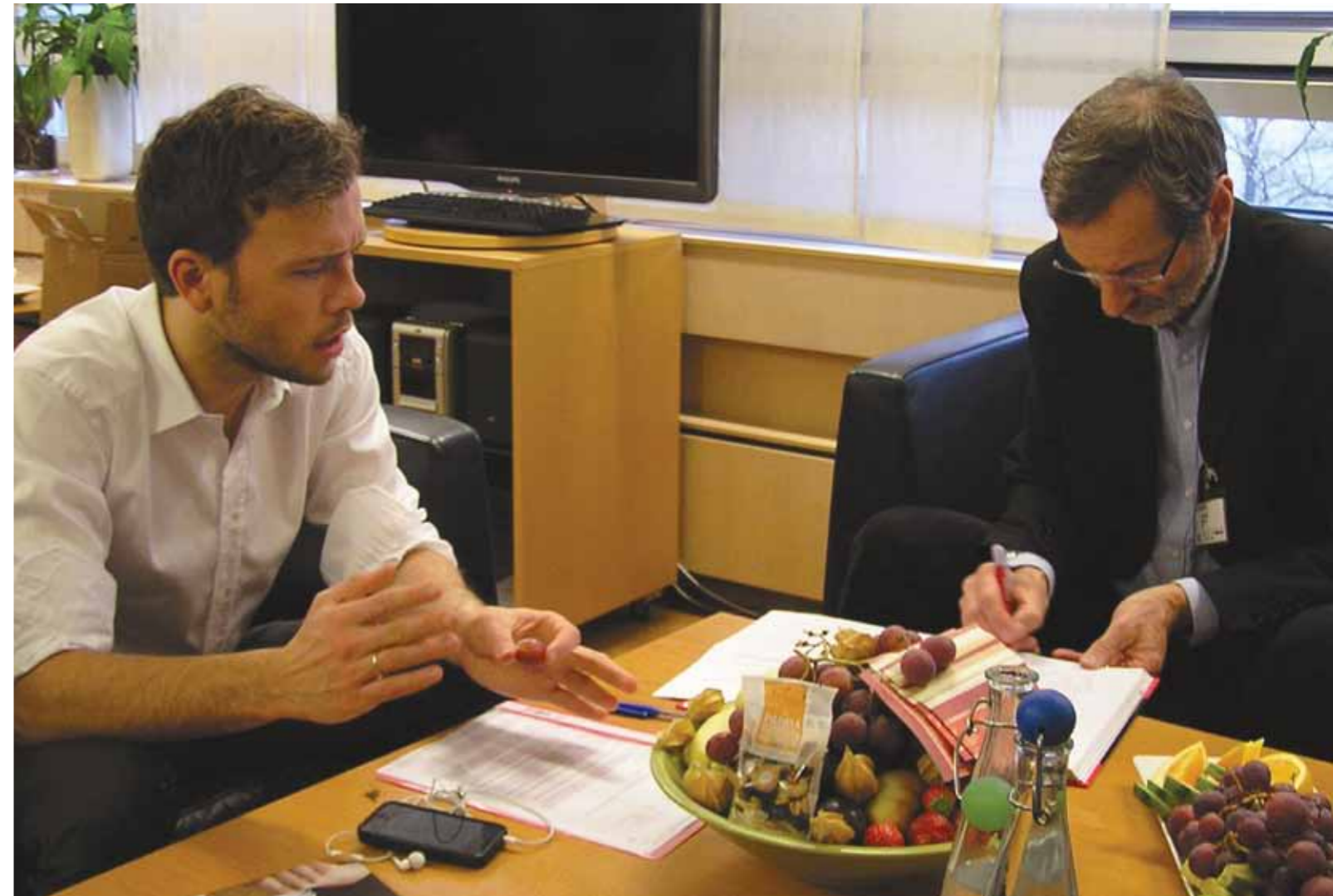
Statsråd Audun Lysbakken tok i mot Familievernets skriftserie på sitt kontor kort etter utgivelsen av Lysbakkens egen pappabok.

– Joda, vi ser noen uvanlige allianser. For eksempel i diskusjonen om pappapermisjon, om kvoter, har jeg jo mye konflikter med høyresiden. Men jeg er på lag med NHO.